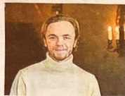
Rallyföreläsaren Oliver Solberg.